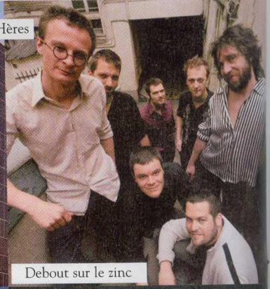
Debout sur le zinc