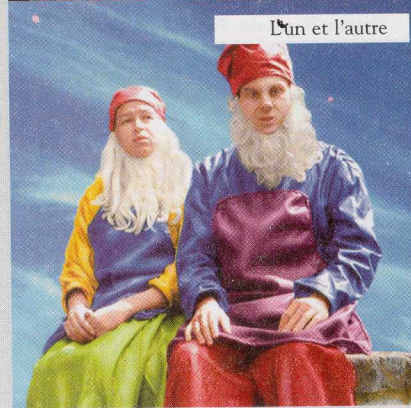
L'un et l'autre